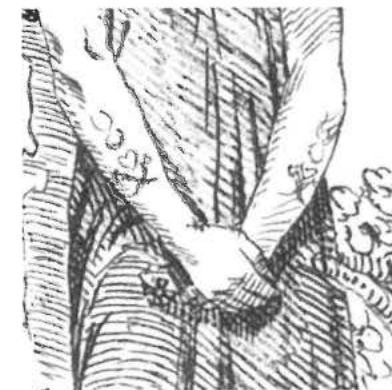
Soldaat of piraat bij ruïne (1844). Op zijn armen tatoeages met harten en sabels (uitsnede). Tekening door Bernardus Theodorus van Loo. Collectie Rijksmuseum