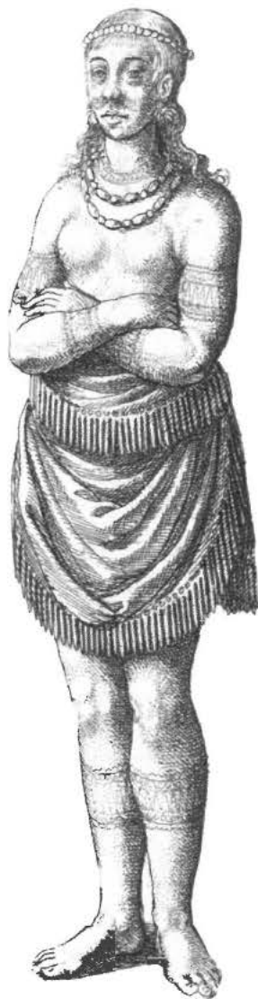
Vrouw uit Virginia, met tatoeages in gezicht en op bovenarmen (1644). Gravure door Theodor de Bry naar een tekening van John White in Thomas Harriot, A briefe and true report of the new found land of Virginia (1588). Collectie Rijksmuseum

achttiende eeuw. In 1817 werd van Daniel Dylius, hoogleraar geneeskunde in Utrecht, de collectie anatomische preparaten op sterk water geveild, waaronder tweemaal 'Een stukje Menschenhuid, waarop een figuur geprikt staat'. 100 Het Universiteitsmuseum Groningen bezit preparaten van tatoeages die eind achttiende eeuw op sterk water zijn gezet door Pieter de Riemer (1769-1831). 101 De hoogleraar anatomie bezat onder meer een 'stuk huid van den arm van een'