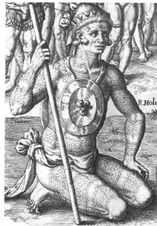
Leider van het oorspronkelijk Amerikaanse volk Utina (Florida) tijdens het raadplegen van een priester. Gravure door Theodore de Bry (uitsnede) uit Collectiones peregrinationum in Indiam occidentalem , deel 2 (Frankfurt am Main 1591).

Tatoeages waren ook een hulpmiddel om de nog levende dragers ervan op te sporen, zoals deserteurs. Ze konden de merktekens immers niet volledig verwijderen. In de Koninklijke Courant worden bij gedeserteerde soldaten tatoeages vermeld. Zo werden bijvoorbeeld in 1809 gezocht: Nicolaas Zwartsz, 29 jaar oud,